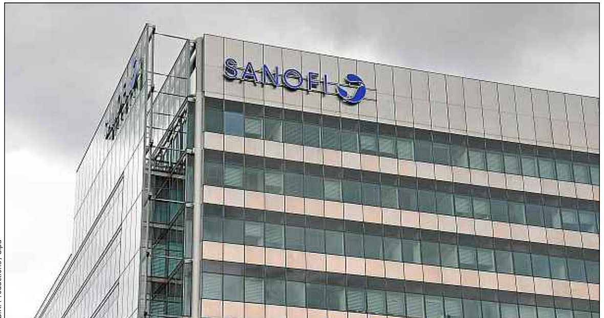
Le groupe pharmaceutique Sanofi a mis fin jeudi à une période de vacance à sa tête en nommant un nouveau patron.